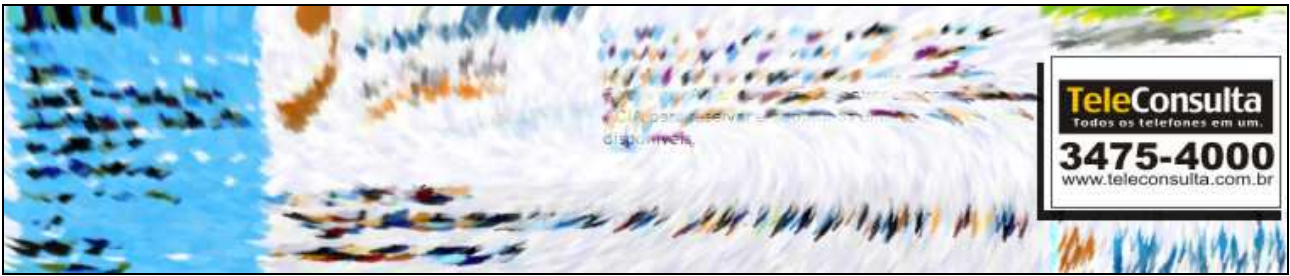
Exemplo de banner lateral direito (TeleConsulta)